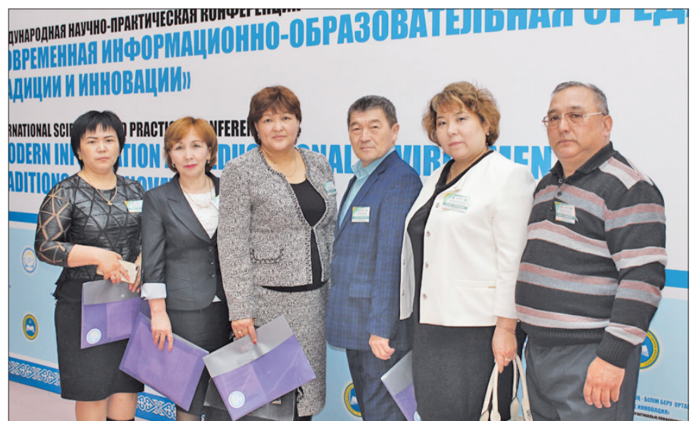
Делегация Тюлькубасского РОНО (Южно-Казахстанская область)