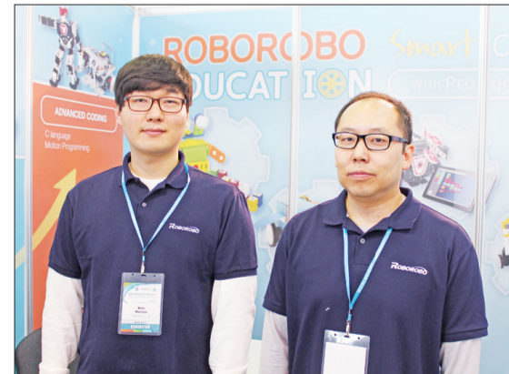
Представители компании ROBOROBO (Сеул, Южная Корея), намеренной активно сотрудничать на казахстанском рынке