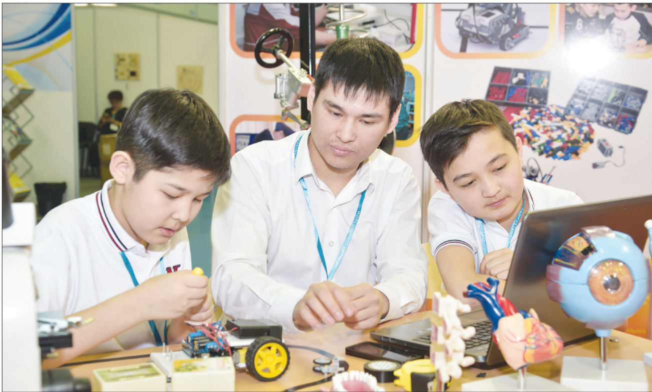
Главные эксперты на выставке – ученики

Выставка в Астане стала незабываемым событием. На ее площадках встретились интересные личности, настоящие профессионалы в своих сферах деятельности, известные люди, энтузиасты из разных стран, городов. У всех павильонов, стендов шли интереснейшие презентации, обсуждения. Интерес посетителей был неподдельный. Жаль, что газетные страницы не могут вместить все моменты, всех, с кем нам довелось общаться. Но мы уверены: впереди еще много встреч! Пожелаем всем успехов во имя процветания одной из самых значимых сфер для всех государств мира – образования!